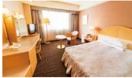
■デラックスシングル ¥2,500追加