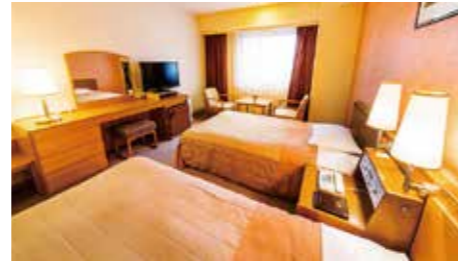
■ツイン(2名様1室) ¥1,500引き