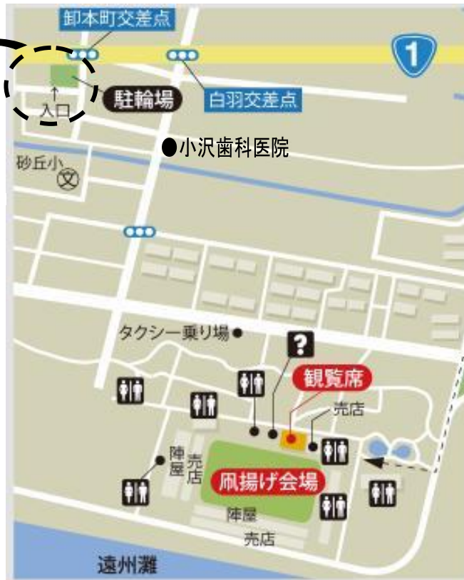
浜松まつり公式ガイドブックより