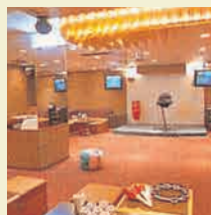
BIF カラオケ&パティスベース マンハッタンアイランド