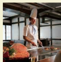
別館 民芸割烹 いなんば