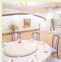
BIF 中国料理 朱茂琳