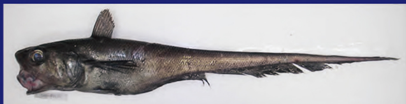
いかつい顔つきでも実は美味しいテナガダラ