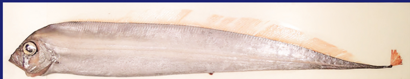
全長1.9 mのサケガシラ