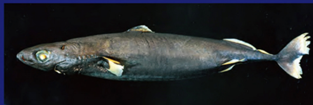
サメの仲間です世界最小クラスのオオメコビトザメ